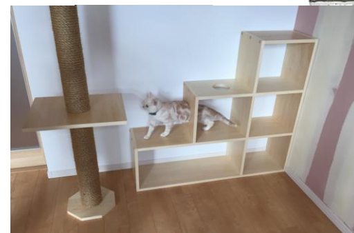
キャットタワー&キャットウォークでネコちゃん満足 (注: 猫は住んでおりません・・・)