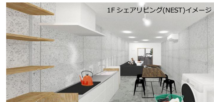
1F シェアリビング(NEST)イメージ